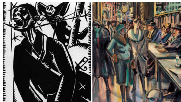
© Frans Masereel Stiftung - Saarbrücken

Retraçant ainsi quinze années de carrière de Frans Masereel, l'exposition permettra surtout de découvrir cette période marquante de notre Histoire à travers le regard de l'un des plus remarquables artistes belges du XX e siècle.