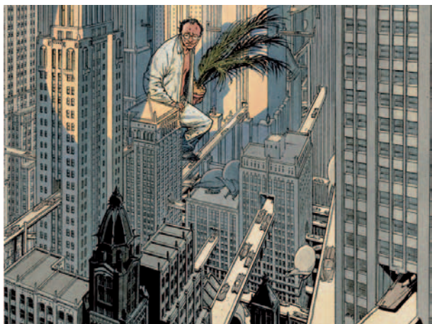
François Schuiten © casterman

À l'occasion des 30 ans des « Cités Obscures », son œuvre la plus célèbre, François Schuiten a pris la décision de confier à la Fondation Roi Baudouin les originaux et les bleus des volumes de cette série dont l'histoire se passe en Belgique. C'est dans ce contexte que la Bibliotheca Wittockiana, chargée par la Fondation Roi Baudouin de garder en dépôt l'intégralité du Fonds Schuiten, a l'honneur d'y consacrer une exposition exclusive. Cette dernière permettra aux visiteurs de se plonger dans l'univers fantastique créé par François Schuiten et d'y découvrir tous les secrets du processus de création.